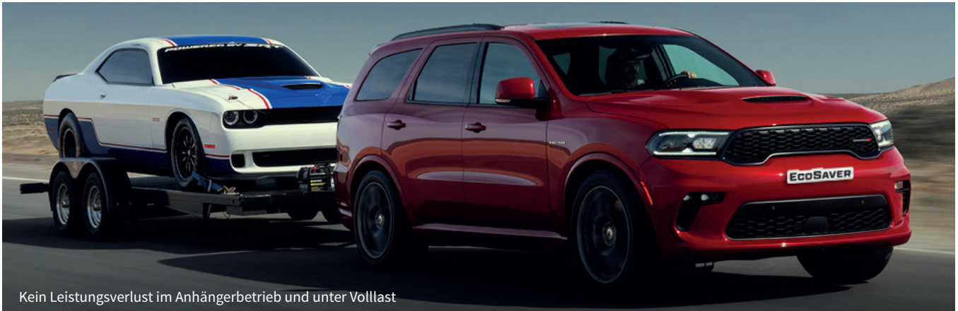
Kein Leistungsverlust im Anhängerbetrieb und unter Volllast